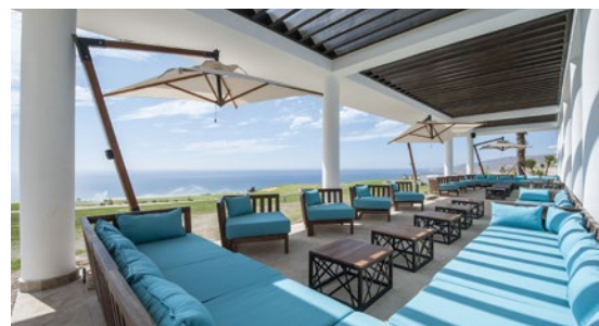
■ La somptueuse vue sur l'Atlantique se poursuit au club-house